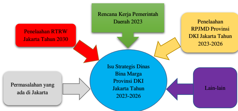
Gambar 2.1 : Komponen Pembentuk Isu Strategis Dinas Bina Marga Provinsi DKI Jakarta

Perumusan program pembangunan daerah bertujuan untuk menggambarkan keterkaitan antara rumusan indikator kinerja program dengan rumusan indikator kinerja sasaran yang menjadi acuan pembangunan jangka menengah daerah.